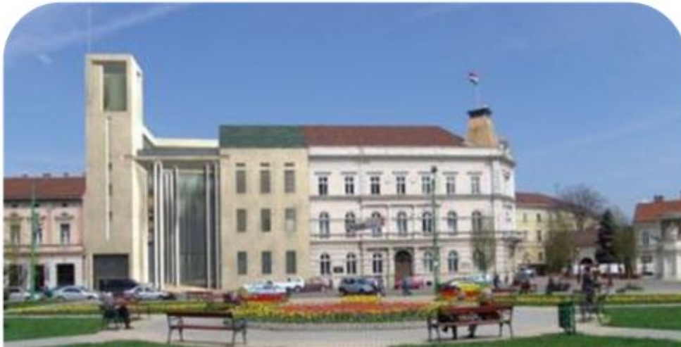
Várocháza. Ilvan lész