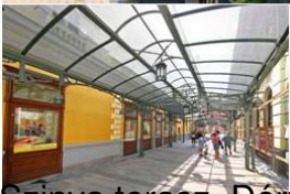
Szinya terasz. Dérné utca. Kandia köz