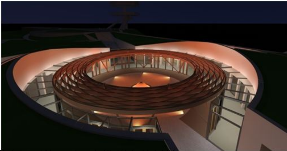
Szachenyi Nádor udvarterasz kialakítása