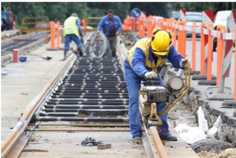
Miskolc városi villamovasút fejlesztése