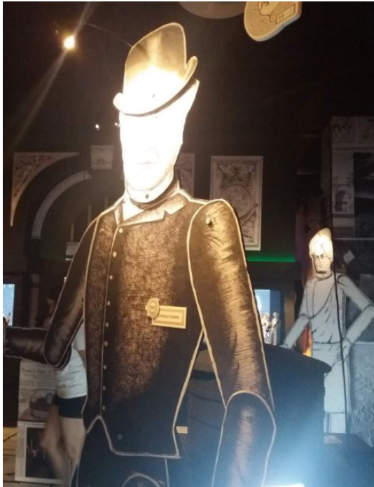
A kiállítás – már csak egy hónapig

Az utóbbi időben sokat olvasni mostanában gyorsan fejlődő technológiákról, mint a mesterséges intelligencia vagy a blockchain, és különböző iparágak reformjáról a digitalizációnak és az automatizációnak köszönhetően. Mégis megdöbbenett és elgondolkodtatott a Tesla kiállítás, amit tegnap láttam a Tesla Budapest Kulturális Központban, a 7. kerületi Kazinczy utcában.